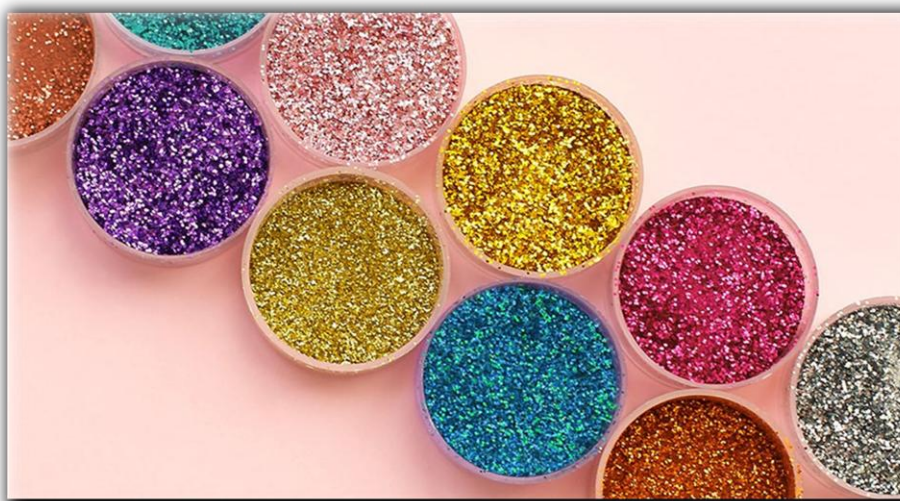
Noelia Infestas 1°ESO

La población ha comenzado a hacer acopio de materiales con purpurina como esmaltes de uñas, ropa con brillantina o tubos de purpurina para manualidades.