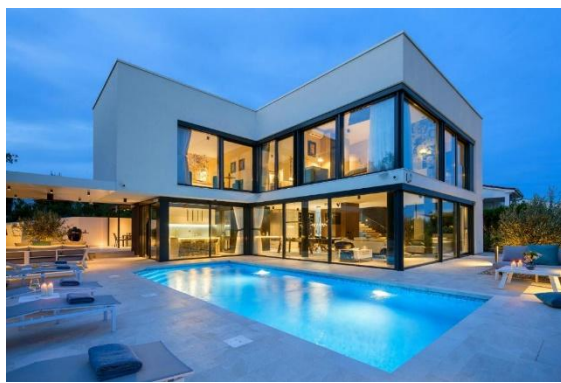
Una villa muy moderna.